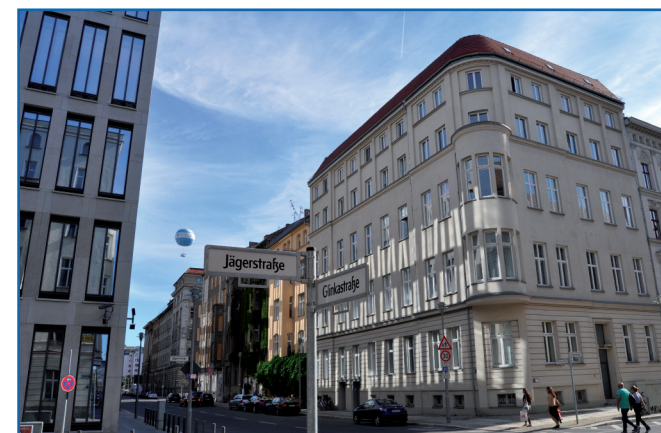
Jägerstraße 6 (Ecke Glinkastraße) 10117 Berlin