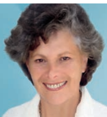
Prof. Dr. Ellen J. Langer

Diesem Credo folgend, wollen wir mit Unternehmern, Managern und Politikern diskutieren, wieviel (unternehmerische) Freiheit unser gegenwärtiges System eigentlich bietet, wieviel Verantwortung auf wieviele Schultern verteilt werden soll und welche Führung bzw. welche Führungskräfte und -persönlichkeiten das Gesundheitswesen braucht, um die immensen ungenutzten Potentiale an Arbeitsplätzen, unternehmerischen Gewinnen, Wohlstand und Leistungsqualität, die im System schlummern, zu realisieren.